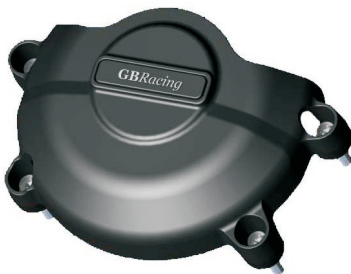
Limadeckelschoner 69€ Best.-Nr. 2-EC-R6-2006-1