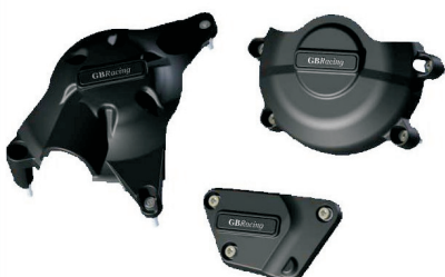
Motordeckelschoner SET (Kuppl. Lima, Pick-up) Best.-Nr. 2-EC-R6-2006-SET 189 €