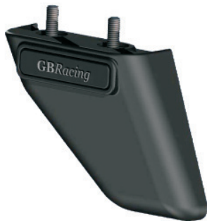
Kettenchutzfinne unten Best.-Nr. 2-CGA08-GBR