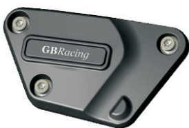
Pick up Deckelschoner 49€ Best.-Nr. 2-EC-R6-2006-3