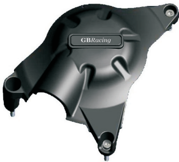
Kupplungsdeckelschoner 79€ Best.-Nr.2-EC-R6-2006-2

Ab 2009 auch zugelassen in der IDM Supersport / Superbike