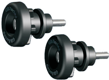
Montagegeständeraufnahmen mit Schwingenschutz Best.-Nr. 2-BA12-6-GBR-SET