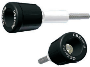
Rahmenprotektoren Best.-Nr. 2-CP-R6-2006-SET